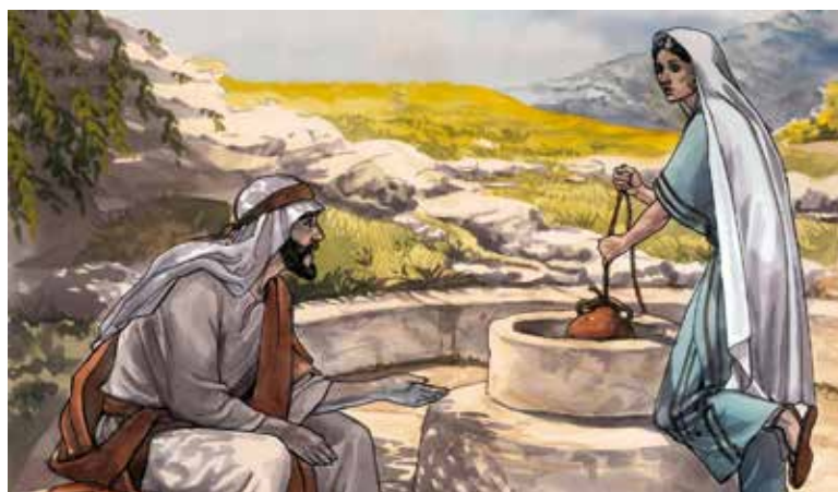
Illustration fra en arabisk tegnefilm om Jesu møde med den samaritanske kvinde. Se den på: vimeo.com/117497747 .

Kvinden forstår, at Jesus er en profet, og hun vil gerne have afklaret jødernes og samaritanernes århundredlange strid om, hvorvidt Gud skal tilbedes på bjerget i Jerusalem eller i Samaria. Baggrunden for