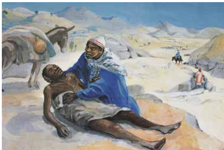
Den barmhjertige samaritaner på afrikansk.